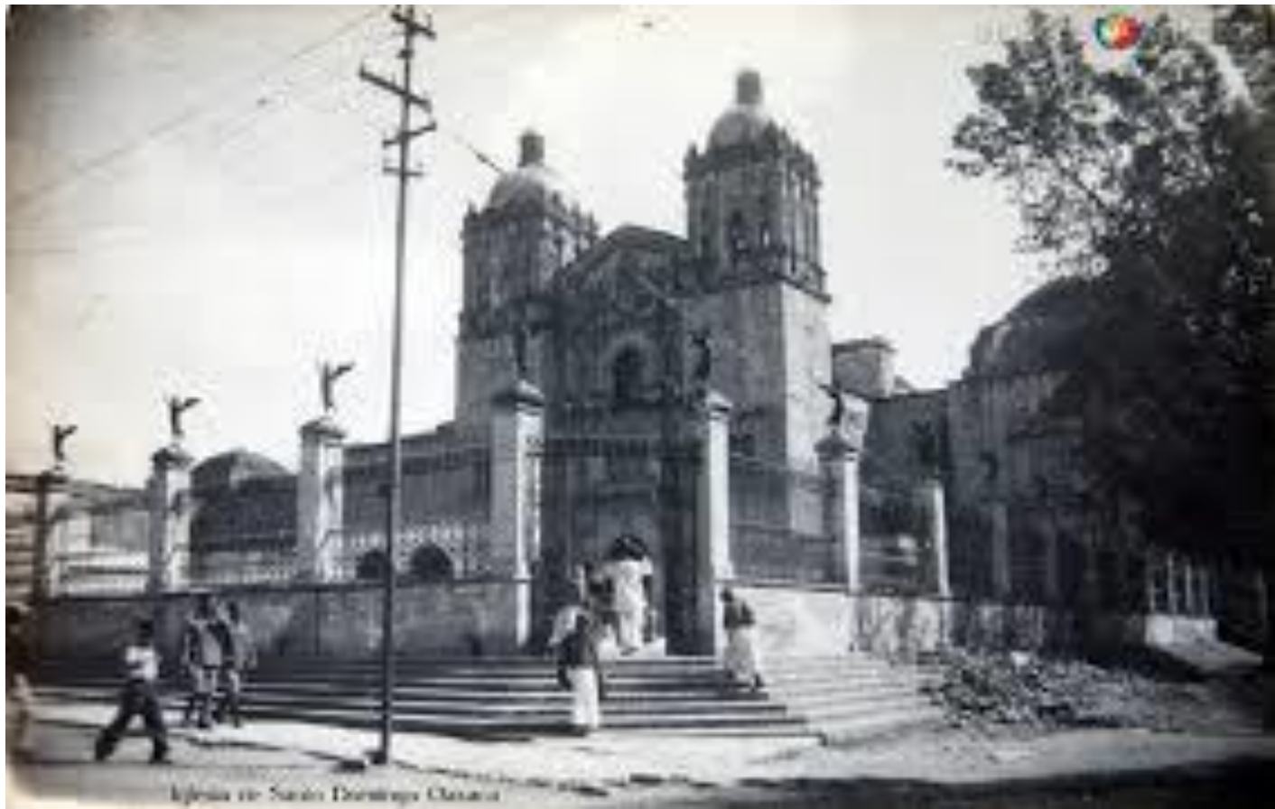
Iglesia de San Sebastián Caracas